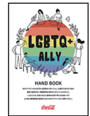
④ このような状態にしたら しっかりと折り目をつけましょう