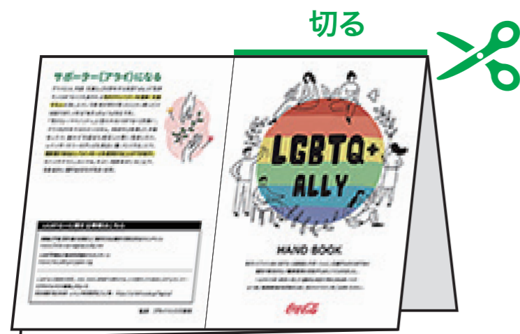
⑤ ③の状態に戻し、一部を切る