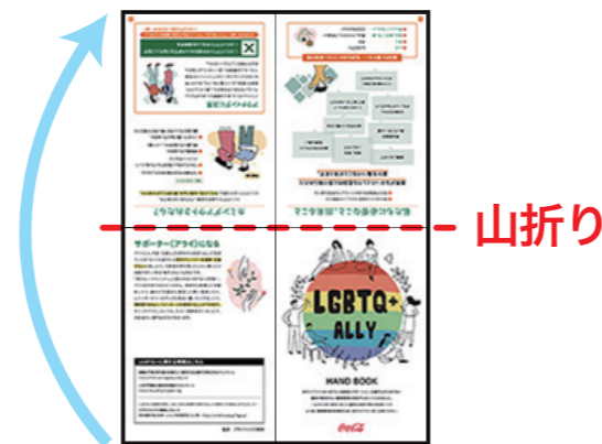
② さらに半分に折る