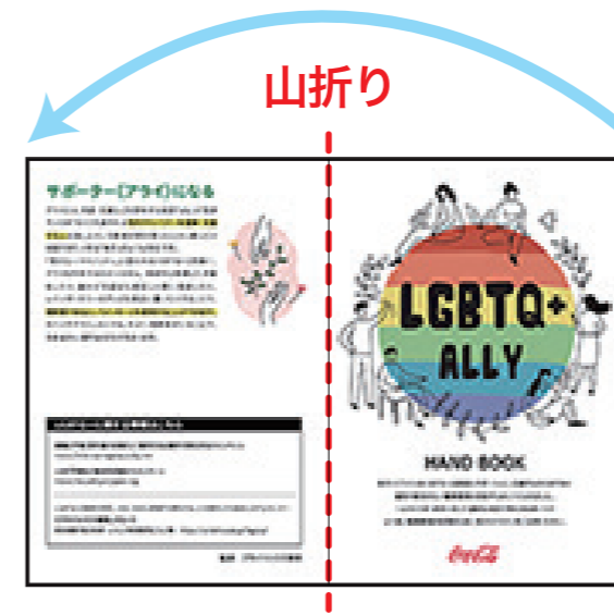
③ さらに半分に折る