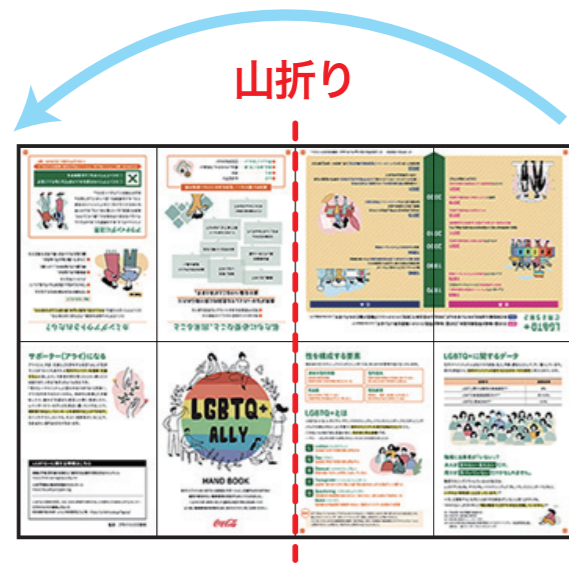
① A3でプリント出力し、 タテ半分に折る